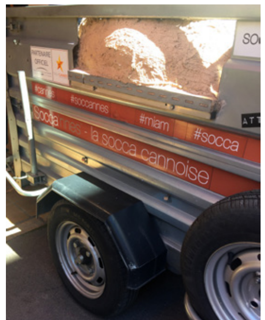
Notre drôle de four se déplace partout !